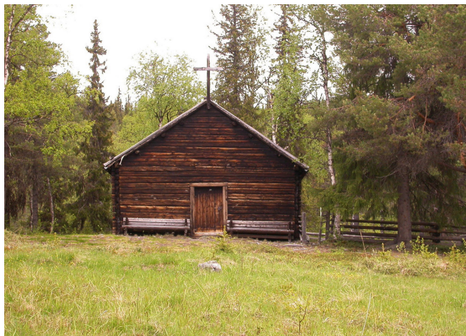
Jilliesnällie, en mötesplats sedan lång tid tillbaka. Det blev naturligt att upprätta ett kapell, vilket skedde 1750 på platsen mitt emellan Sorsele och Ammarnäs. Dagens kapell är från 1940.

År 1673 utfärdades det första lappmarksplakatet där nybyggare erbjöds 15 års skattefrihet. Intresset var dock lågt och det var ytterst få nybyggare som sökte sig till Lappmarken. Åren 1695 och 1749 kom nya plakat och reglementen för att locka nybyggare men nu fanns flera inslag som syftade till att skydda samernas näringar. Nybyggarna tilläts inte att jaga och fiska längre än fem km från sitt nybygge. Samtidigt uppdrogs lappmarksgränsen, det vill säga gränsen för nuvarande landskapet Lappland mot Västerbotten och sedermera Norrbotten. Lappmarksgränsen skulle avskilja det område där lappmarksreglementet gällde från bondelandet. Den som ville ta upp ett nybygge där måste först skicka in en ansökan som kunde avslås om nybygget inskränkte på samernas renskötsel och fiske.