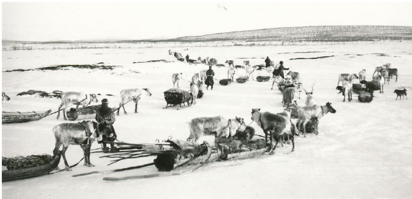
Vårflytt i Vassdalen, 1950-tal. Redan på 1600-talet var transporter med ren och ackja effektivt, längs den så kallade Kristinavägen mellan Nasafjäll och svenska kusten.

Tiock fängslades 1664 och dömdes till fängelse. Han hade bland annat tagit emot mutor från de som hade råd att köpa sig fria från hållappstjänsten.