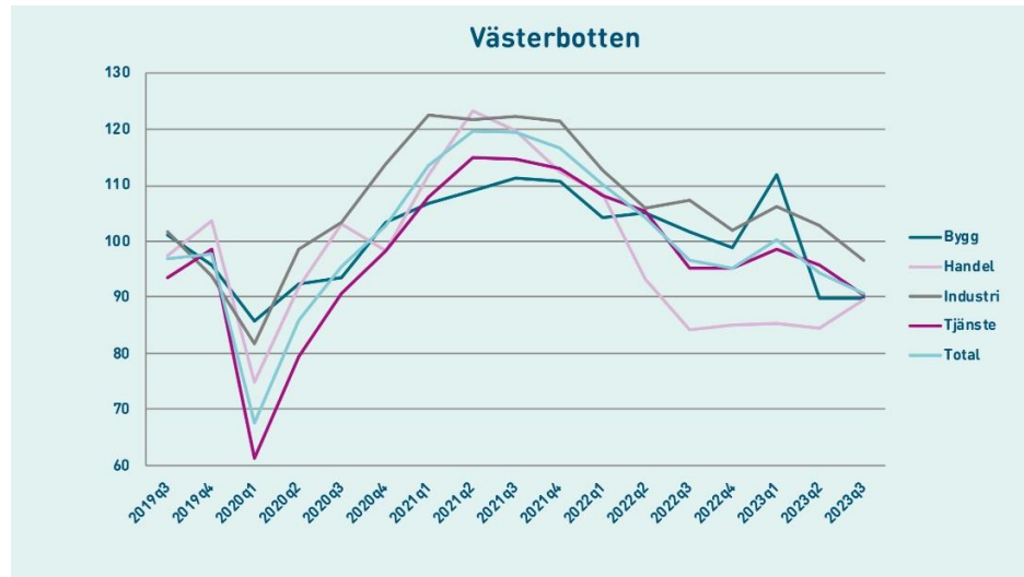
Figur 1. Konfidensindikatorn tas fram genom en företagsenkät och mäter nuläget i näringslivet samt hur företagen ser på den närmaste framtiden (källa Norrlandsfondens konjunkturbarometer 2023 )