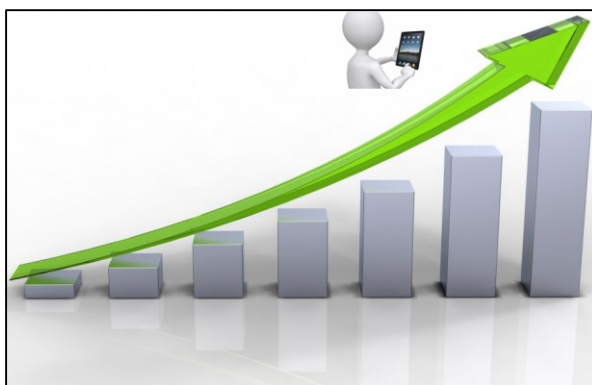
Figur. E-förvaltning, verksamhetsutveckling med stöd av IT – långsiktig ökad digitalisering

IT-strategin, som utarbetats i ett samarbete mellan Kommunövergripande IT-samordning 4 och de verksamheter som ska stödjas, är Umeå kommuns övergripande styrdokument inom IT-området. Det är förvaltningens ansvar att använda IT-strategin. Kommunens verksamheter tar fram vilka insatser som behöver utföras för att möta IT-strategins vision på både kort och lång sikt. IT-strategin är tillsammans med verksamheternas egna strategier och planer (nationella styrdokument, systemförvaltnings-, teknik-, IT- och verksamhetsplaner) styrande för användning och utveckling av informationsteknik. IT-strategin, som utgår från Regional Digital Agenda för Västerbotten, fokuserar på vad kommunen vill uppnå med e-förvaltningsarbetet.