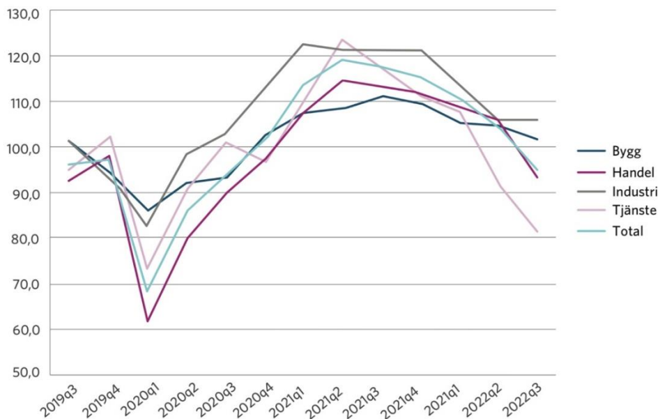
Figur 1. Konfidensindikatorn för näringslivet i Västerbotten har försvagats under 2022 i linje med övriga län och riket. Konfidensindikatorn tas fram genom en företagsenkät och mäter nuläget i näringslivet samt hur företagen ser på den närmaste framtiden

Umeås näringsliv karaktäriseras av en väldigt stor branschbredd och en diversifiering med en tredjedel anställda inom tillverkande industri, företagstjänster samt platstjänster. Det har tidigare inneburit att Umeå klarat konjunktursvängningar betydligt bättre än de flesta andra platser. Till det kommer också det stora inslaget av offentliga arbetstillfällen som är mindre känsliga för skiftningar i konjunkturen.