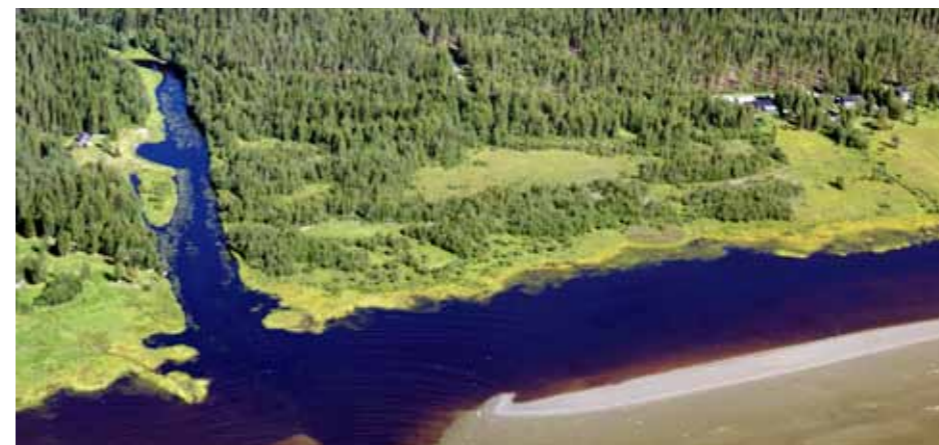
Sörmjöleåns utlopp med värdefulla rastplatser för fåglar på de föränderliga sandbankarna. De flacka stränderna vid Lundvikssanden lämpar sig väl för restaurering av betade havsstrandängar