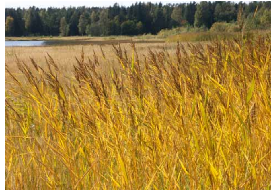
De igenvuxna stränderna längst inne i Mjölefjärden kan restaureras till öppna betade strandängar.