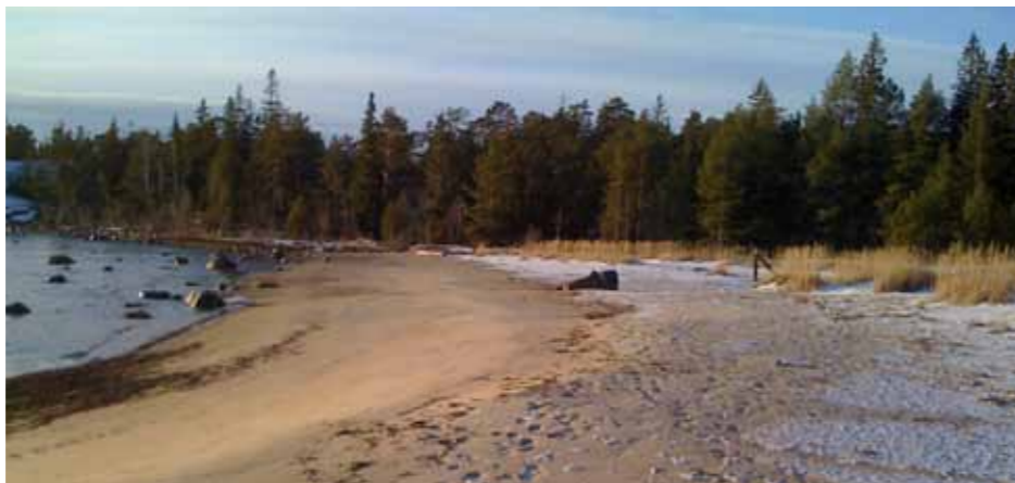
De fina sandstränderna i Sörmjöle - Norrmjöle lockar till besök året om. På bilden Klössand i december

Inom delområdet har vattenområdena bedömts ha god status med hänsyn till Vattendirektivet. Badvattendirektivet pekar ut Norrmjöle och Sörmjöle havsbad vilket innebär en hög skyddsnivå för spillvattenrening vilket kan kräva t.ex. med samfälliga gemensamma anläggningar eller kommunal anslutning.