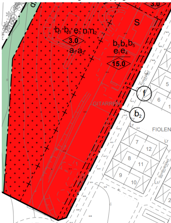
Figur 2 Utsnitt ur plankartan med bestämmelser som justerats och lagts till efter granskning.

För att ytterligare säkra skolgårdens kvaliteter för landskapsbilden och omhändertagande av dagvatten har bestämmelserna n och a 2 införts. N innebär att träd endast får fällas om det är sjukt eller utgör en säkerhetsrisk och a 2 innebär att marklov även krävs för markåtgärder som kan försämra markens genomsläpplighet.